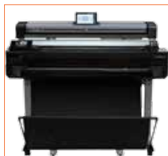
Optionales höhenverstellbares Untergestell zur Platzierung auf dem Drucker.