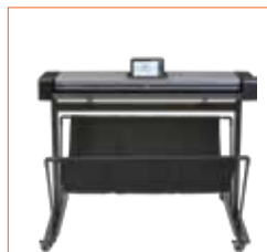
Platzierung ohne höhenverstellbares Untergestell für eine Anordnung nebeneinander.