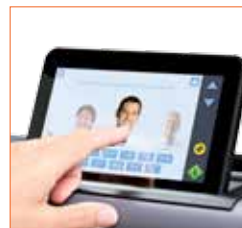
Durchsuchen Sie auf SD One MF Benutzerprofile und scannen Sie direkt an Speicherorte, die für jeden einzelnen Benutzer voreingestellt sind.