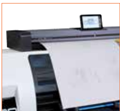
SD One MF ist leicht genug, um auf jeder ebenen Fläche oder einem optionalen, höhenverstellbaren Untergestell platziert zu werden.

SD One MF verfügt über eine integrierte Software zur Druckerverwaltung, über die Sie die Kosten jedes Scans, jeder Kopie oder jedes Ausdrucks nachverfolgen können – perfekt für Situationen, in denen Sie Kosten verrechnen müssen.